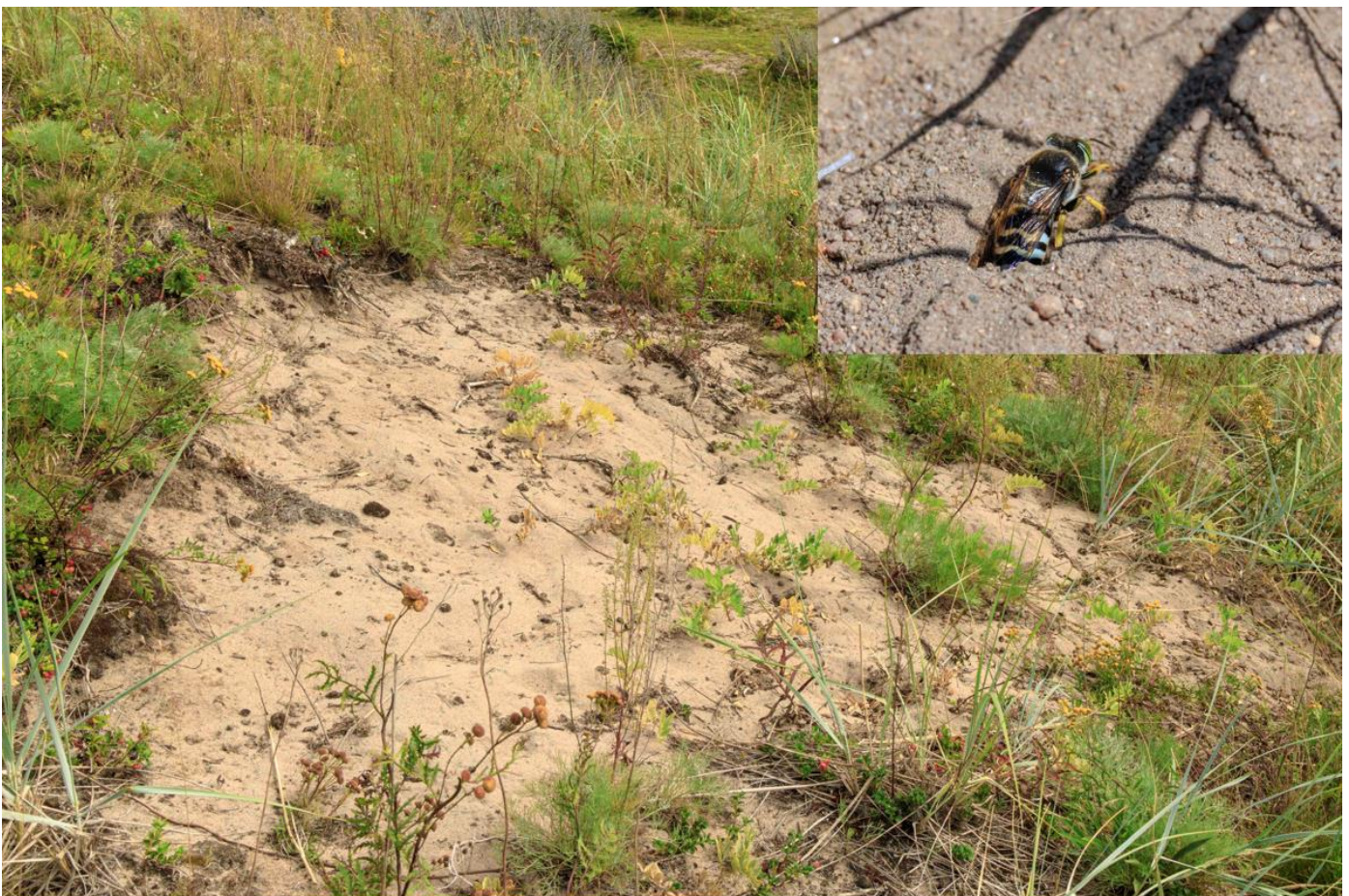
Bild 8. Öppen sandblotta som är idealisk för markbyggande steklar (åtgärd 6).