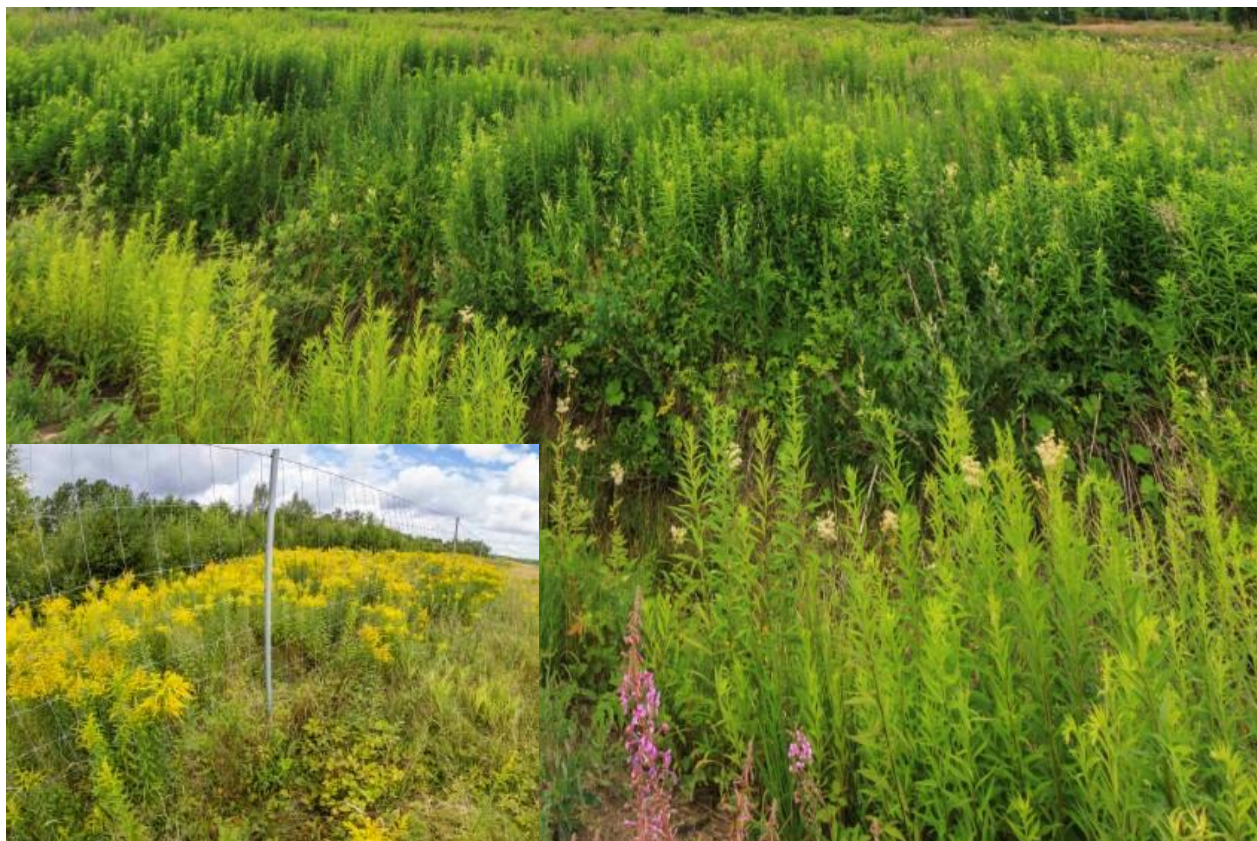
Bild 10. Kanadensiskt gullris kan bli helt arealtäckande om växten får föröka och breda ut sig ohejdat (åtgärd 8).