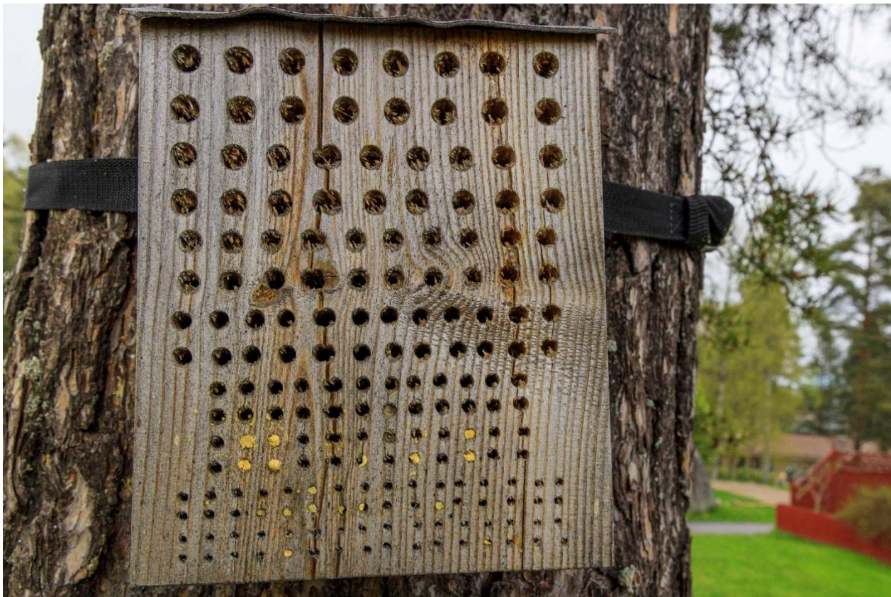
Bild 9. Ett exempel på hur ett "bihotell" kan se ut. Som framgår av bilden behövs det inte så här många grova hål utan det är bättre med fler i de mindre dimensionerna (åtgärd 7).