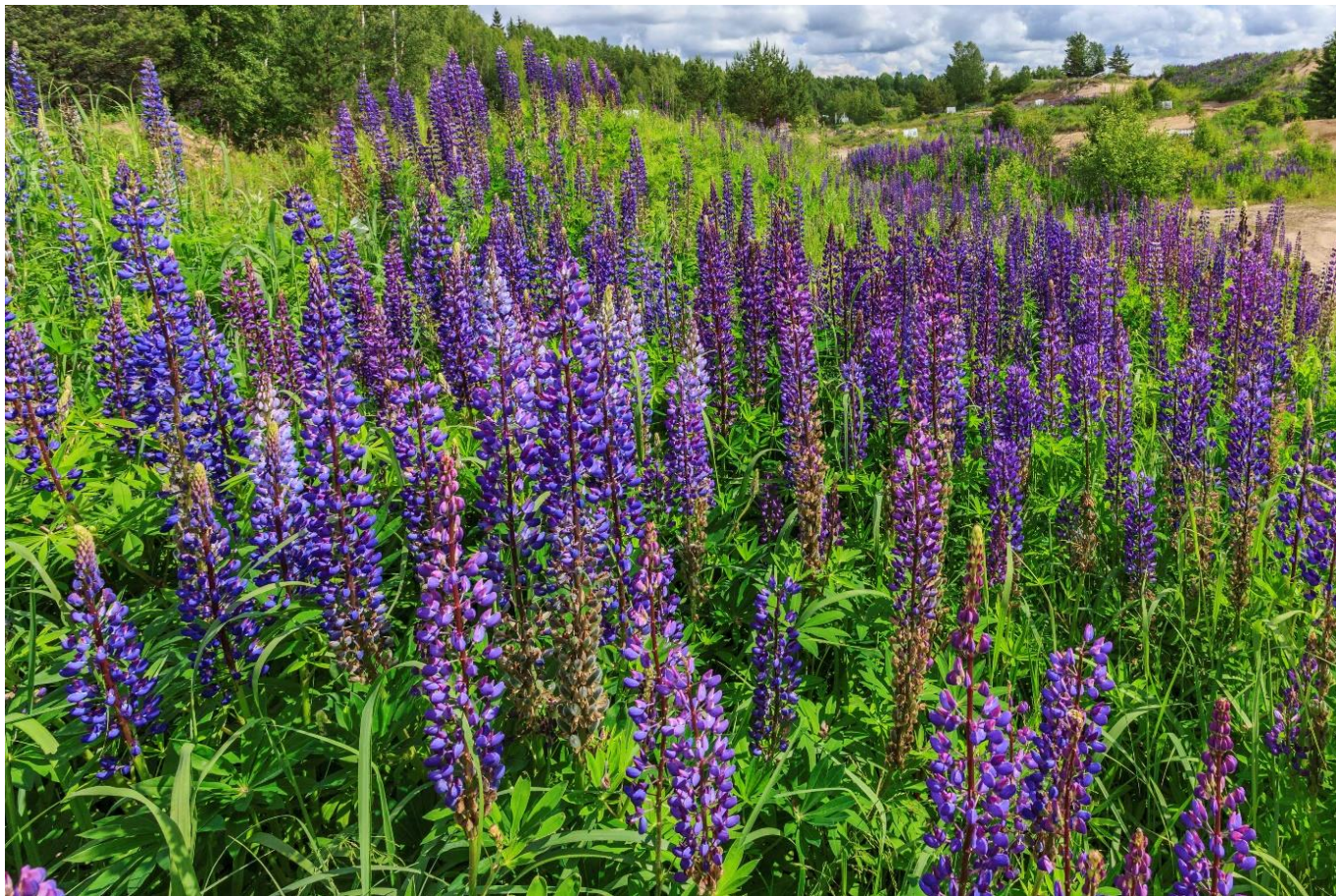
Bild 11. Lupin kan bli helt arealtäckande om växten får föröka och breda ut sig ohejdat (åtgärd 8).