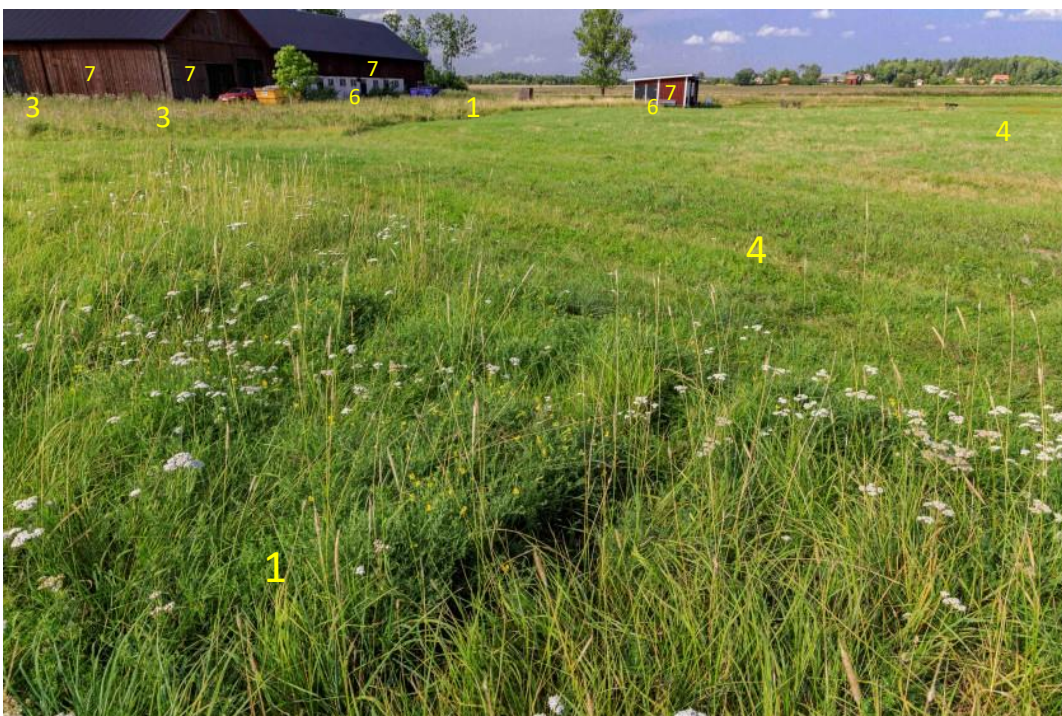
Bild 2. Exempel på kulturgynnade ängsväxter som finns i den befintliga gräsvegetationen (åtgärd 1).