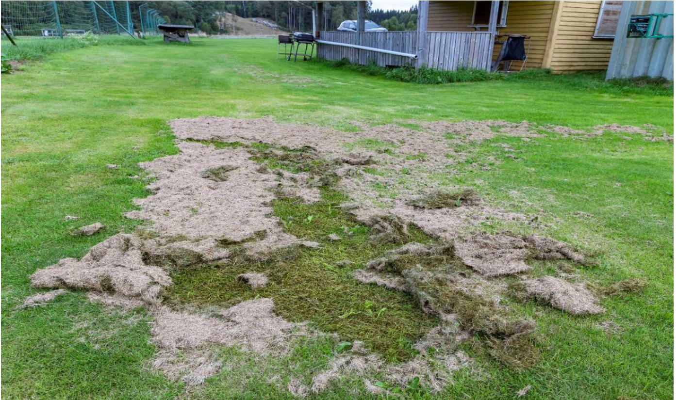
Bild 7. Gammalt gräsklipp som får det underliggande gräset att skadas och eventuellt dö (åtgärd 5).