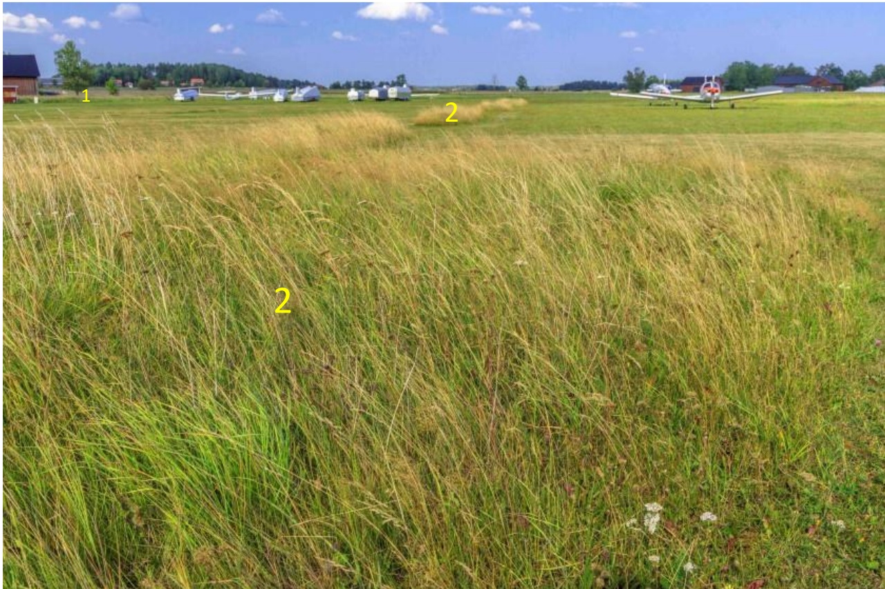
Bild 3. Stråk med oklippt vegetation inom uppställningsområdet. Anlägg större arealer av ängmarksvegetation där så är möjligt (åtgärd 2).