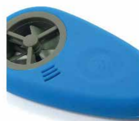
WeatherFlow WEATHERmeter SEK 795