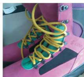
Crispi Skärmflygkängor (s... SEK 1.200