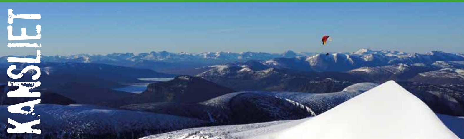
Hang över Kebnekaise