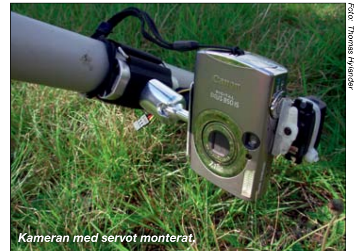
Kameran med servot monterat.