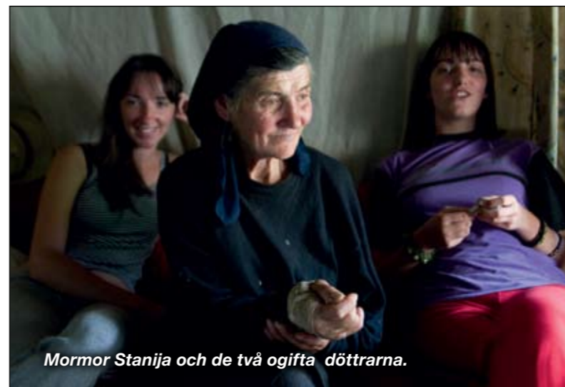
Mormor Stanija och de två ogifta döttrarna.