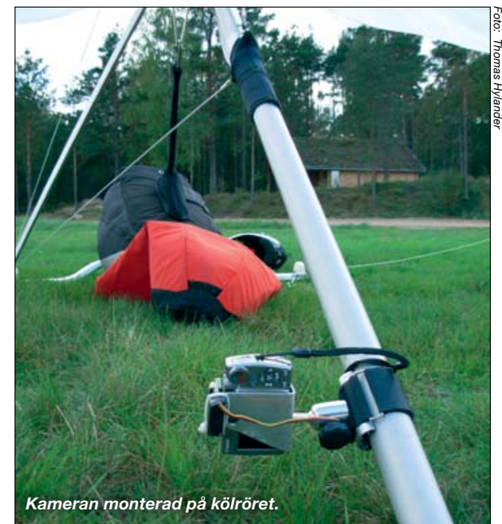
Kameran monterad på kölröret.