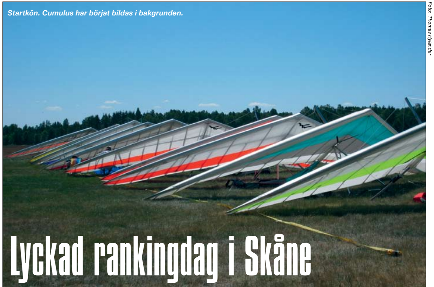
Startkön. Cumulus har börjat bildas i bakgrunden.