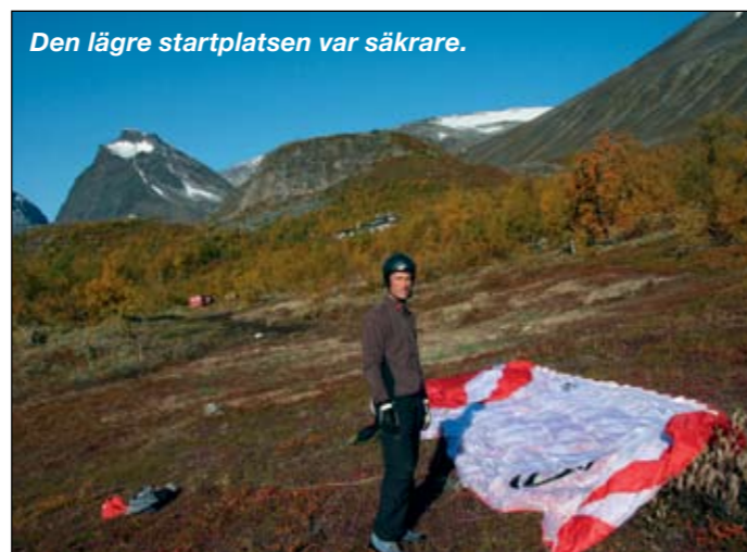
Den lägre startplatsen var säkrare.