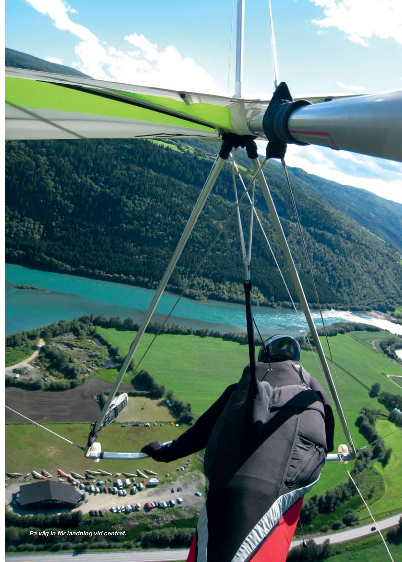
På väg in för landning vid centret.

Måndag 21 juli. Första tävlingsdagen i Vågå Open. 30 tävlande med Ove och Niklas som enda utlänningar. På grund av nordlig vind bestäms det att man ska åka till Böverdalen i utkanten av Jotunheimens nationalpark. Ett märkt bergsområde med Norges högsta berg Galdhøpiggen på 2 469 meter över havet. Starten vid Juvasshytta ligger på 1 800 meter och här ligger också det Norska sommarskidcentret.