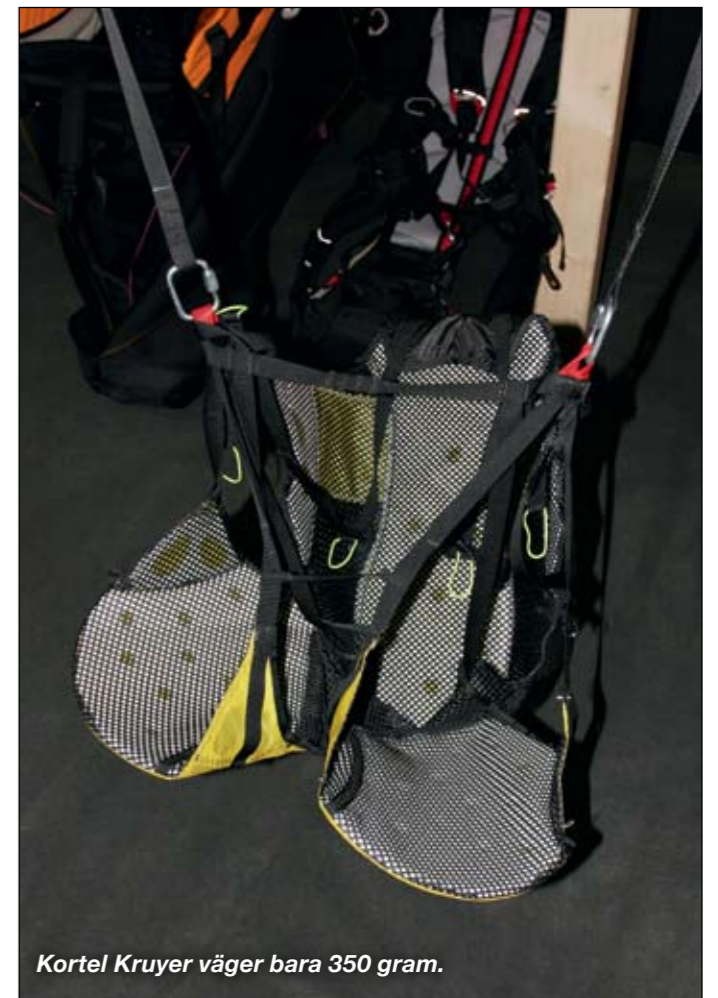
Kortel Kruyer väger bara 350 gram.