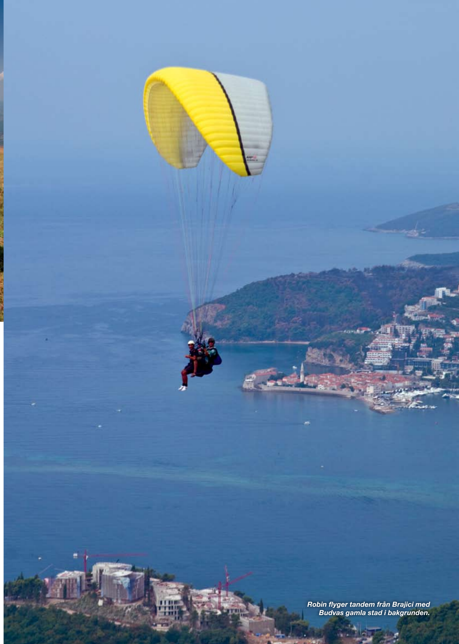
Robin flyger tandem från Brajici med Budvas gamla stad i bakgrunden.

Vid landningen gäller det att hålla tungan rätt i mun eftersom stranden är packad med folk. Men en liten ruta är avspärrad för oss, bara man undviker stolpar och hus under själva inflygningen. Detta gäller bara från mitten av juni till augusti, resten av året finns det gott om plats på hela stranden.