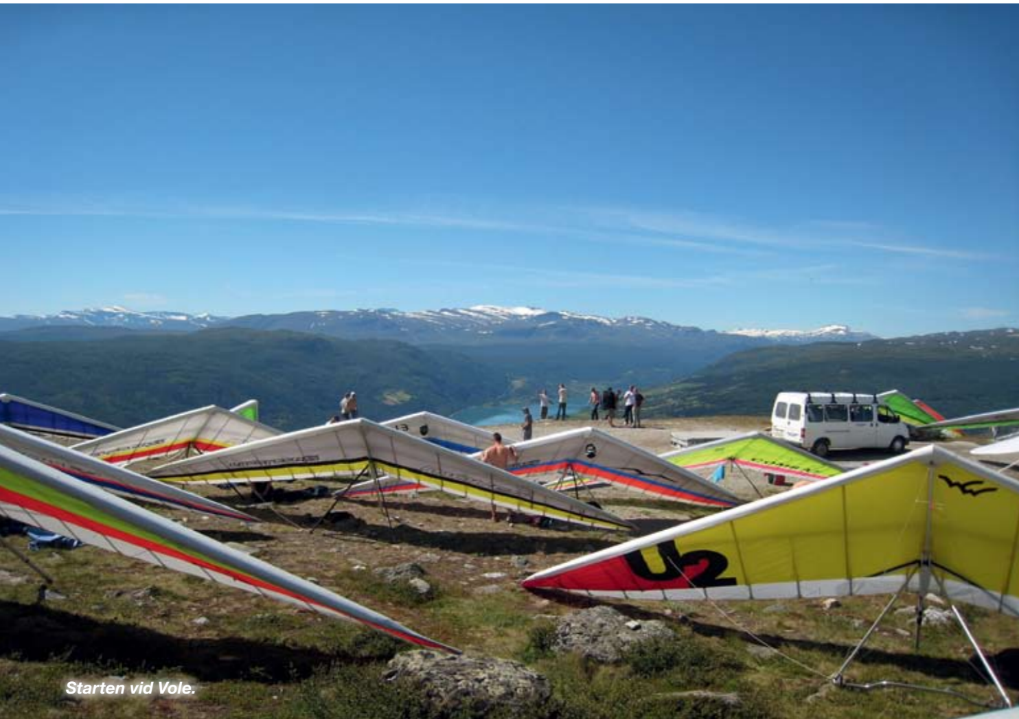
Starten vid Vole.

nalpark med alla snöklädda fjälltoppar. Passar därför på att ta en hel del bilder med kameran som är monterad på kölröret. Jag gör branta svängar, fäller upp visiret och smilar mot kameran... Tyvärr visar det sig när jag landat att något gått fel med avtryckaren igen, så det blev inte en enda bild!