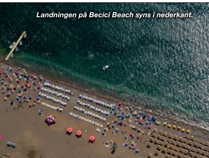
Landningen på Becici Beach syns i nederkant.