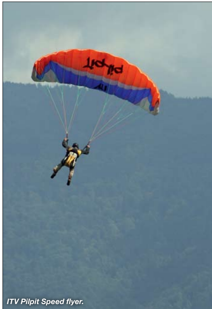
ITV Pilpit Speed flyer.

En och annan ny skärm som ser fin ut finns det väl. Men inget fantastiskt.