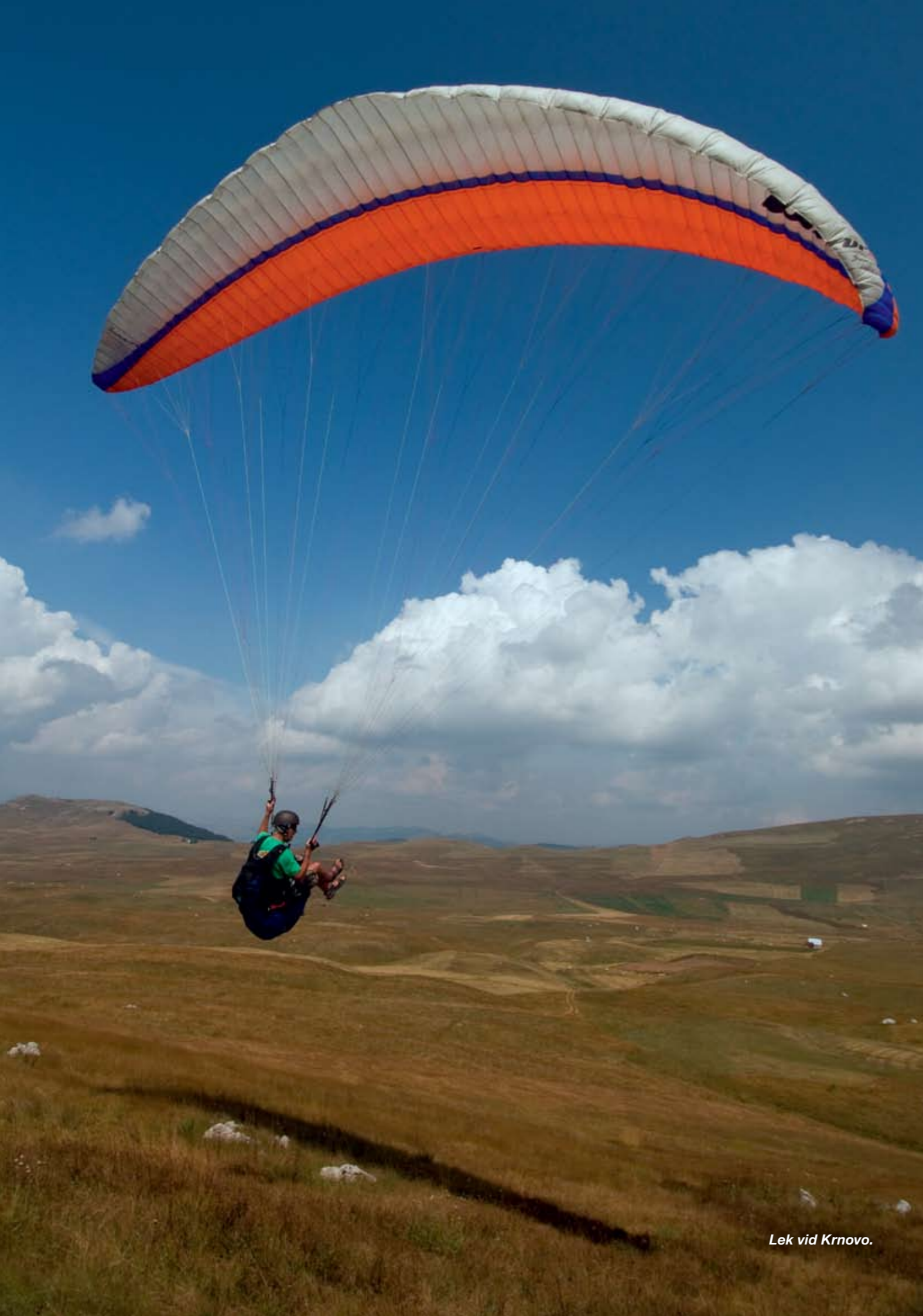
Lek vid Krnovo.