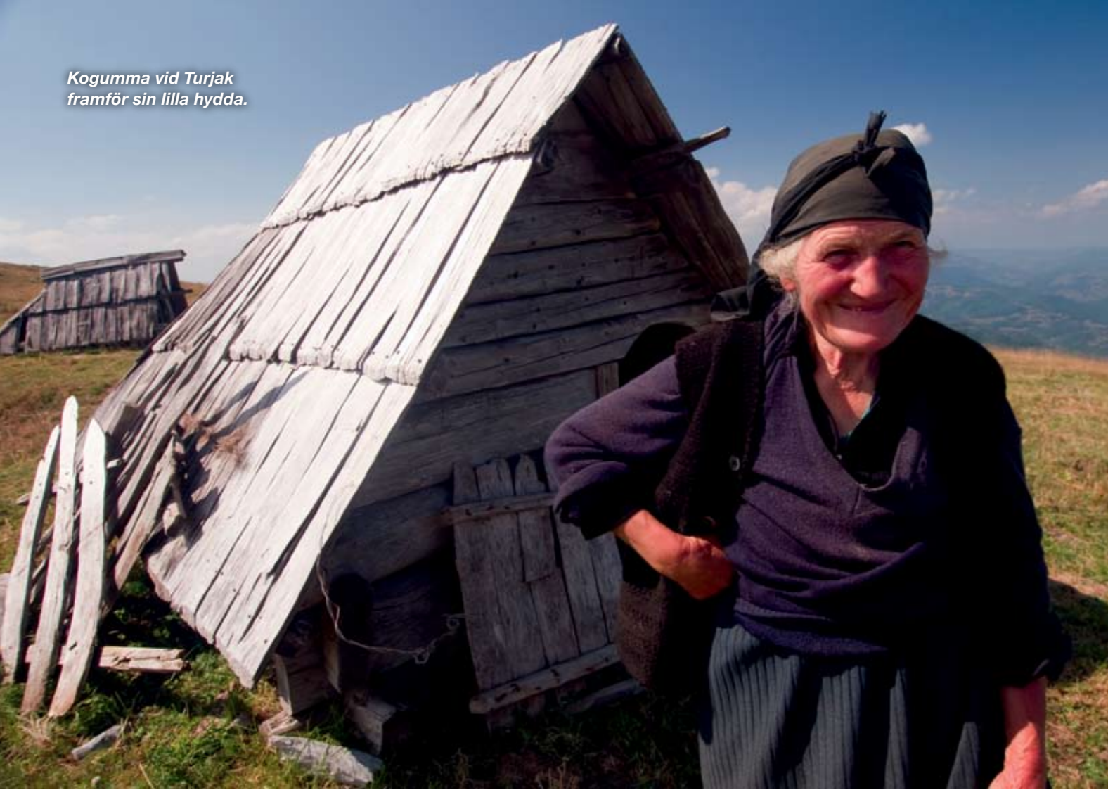
Kogumma vid Turjak framför sin lilla hydda.

M ontenegro är ett av Europas yngsta länder, den lilla Balkanstaten blev självständig från Serbien så sent som sommaren 2006. Det här är ett klassiskt forna Jugoslavien-land med sol, slivovica och machokillar. Men Montenegro har framgångsrikt lockat turister till sin lilla kustremsa, inklusive svensk charter, och de senaste åren har också skärmflygare hittat hit.