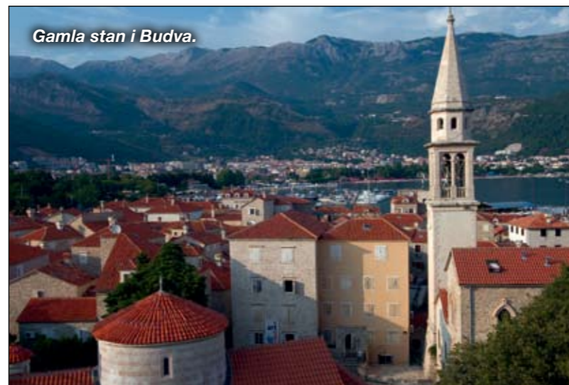
Gamla stan i Budva.