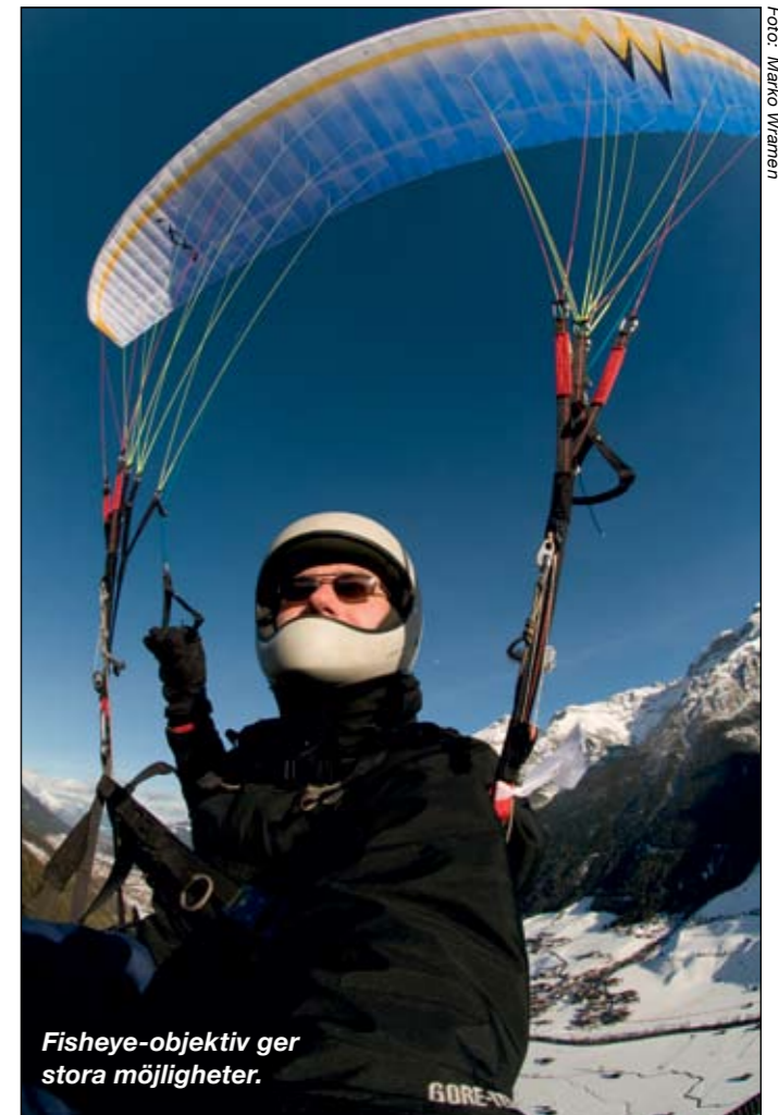
Fisheye-objektiv ger stora möjligheter.

Med fisheye-linsen kan jag faktiskt få med både mig själv och det mesta av min skärm, utan extra hjälpmedel. Jag skulle kunna sätta kameran på en pinne, men det blir tungt med ett så här stort monster.