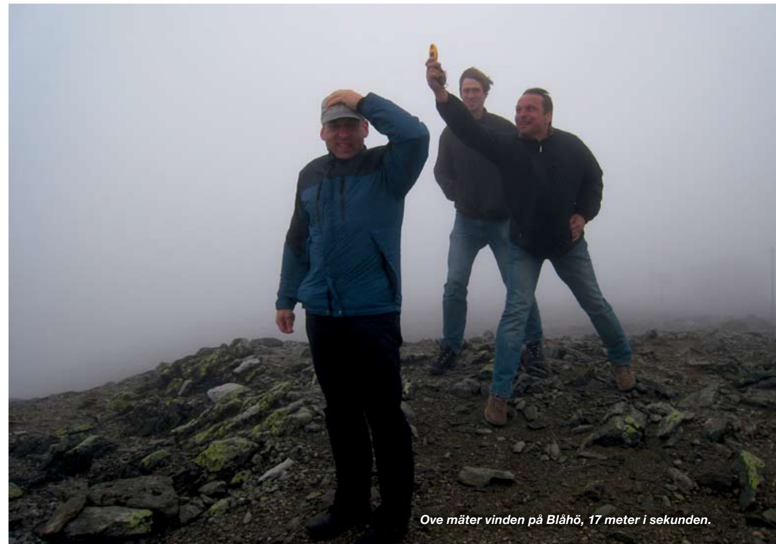
Ove mäter vinden på Blåhö, 17 meter i sekunden.

Snart är jag uppe på starten igen, nästan alla tävlande har startat. Det blåser lite mer så jag tvekar på var jag ska starta men beslutar mig för att bära bort grejorna till skärmstarten igen. Har två tyskar framför mig i startkön. Den ene kommer iväg, men... inte den andre. Ett stort molnflak skymmer solen