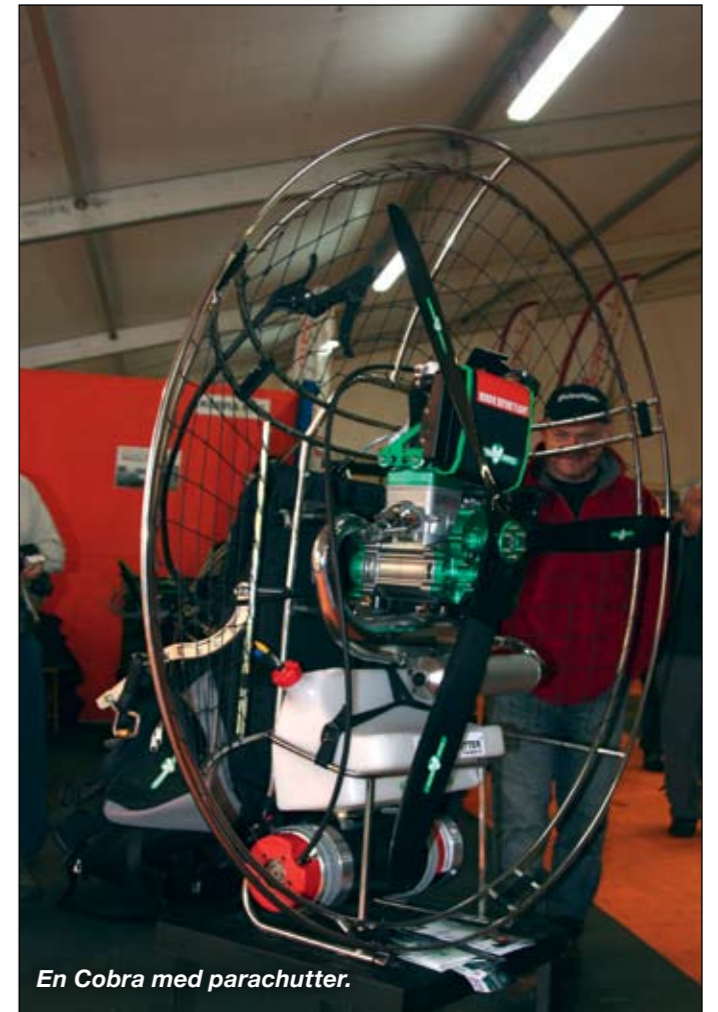
En Cobra med parachutter.

Mer nyheter för den stora mängden piloter då? Nja.