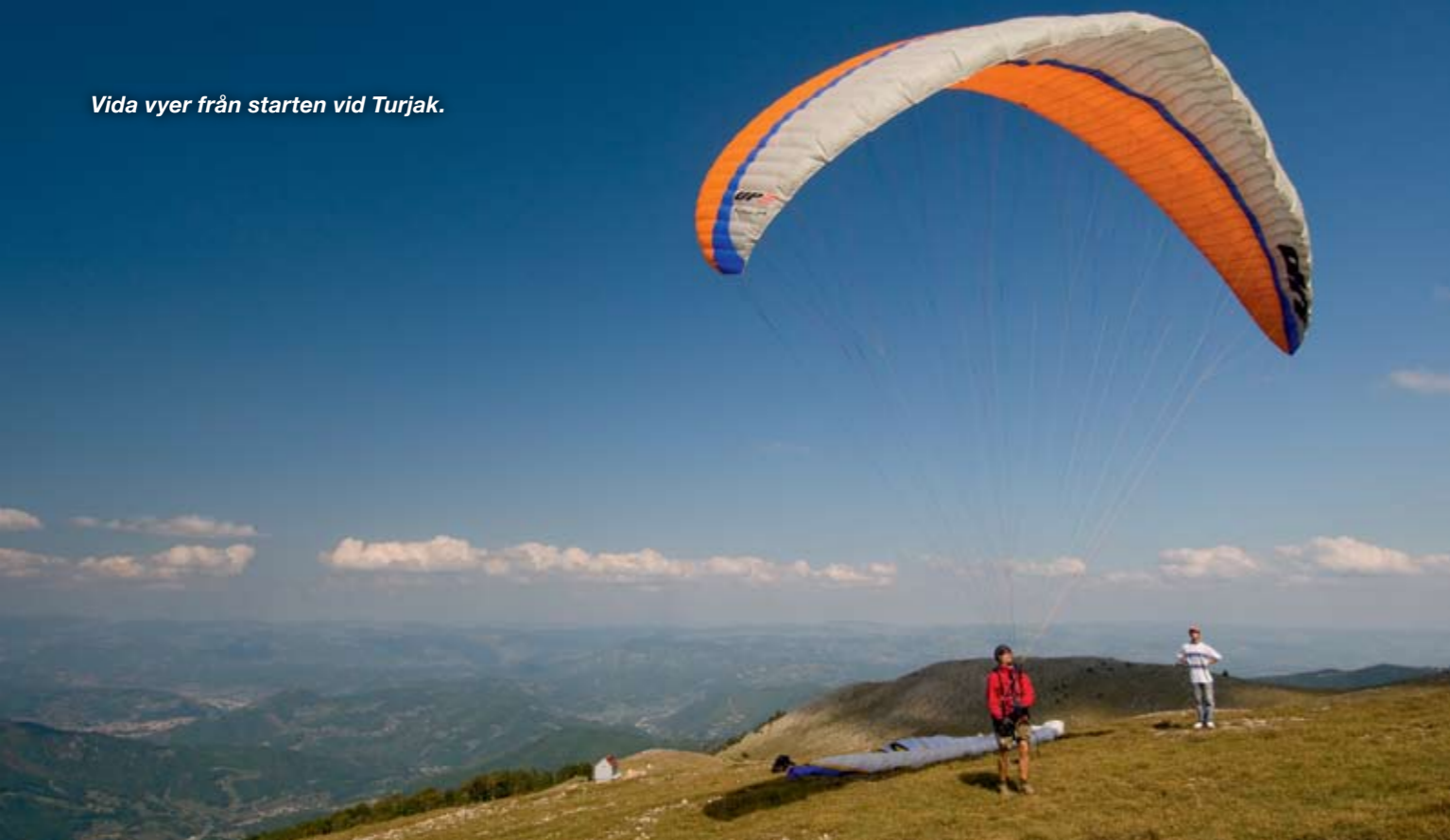
Vida vyer från starten vid Turjak.