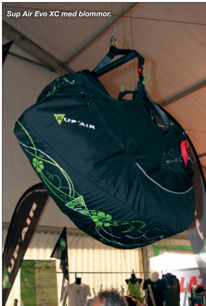
Sup Air Evo XC med blommor.

Att besöka Coupe Icare är en fröjd för öga och gom. Maten och folklivet är fantastiskt. Är vädret dåligt finns det film att se på från morgon till kväll. Mässan är komplett. Åk dit och upplev skärmflygningens årliga centrum. Det är väl värt resan.